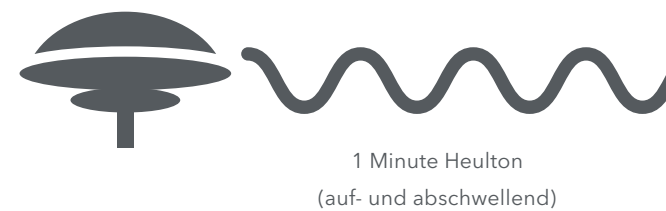
1 Minute Heulton (auf- und abschwellend)

KATWARN ist ein bundesweit einheitlicher Warndienst fürs Mobiltelefon, der auch vom Landkreis Groß-Gerau genutzt wird. Bei Unglücksfällen wie Großbränden, Bombenfunden oder Wirbelstürmen senden die verantwortlichen Katastrophenschutzbehörden, Feuerwehreinheiten oder der Deutsche Wetterdienst über KATWARN Warninformationen direkt und ortsbezogen an die Mobiltelefone der betroffenen Bürgerinnen und Bürger. KATWARN bietet damit zusätzlich zu Lautsprecheransagen, Sirenen und Rundfunk Informationen, die lebenswichtig sein können. Nähere Informationen zur KATWARN erhalten sie auf der Homepage www.gg112.de oder unter www.katwarn.de .